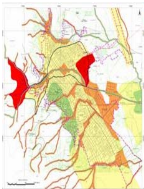
Mapa de Peligros